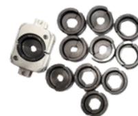
Prensador y Matrices