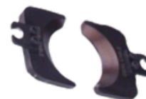
Prensador y Matrices