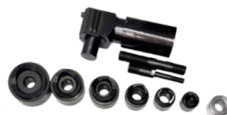
Sacabocado y Matrices