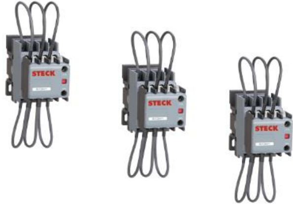
SK1C25 SK1C32 SK1C43 SK1C63 SK1C95 SK1C115

Alta durabilidad, tamaño compacto y fijación rápida.